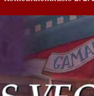
17. Leiklistin og hafíð Sýning í sjómínjasafninu Víkinni, 20. 2.2010.