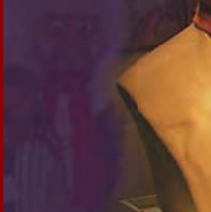
7. Við krefjumst fortíðar – Svart og sykurlaust Sýning í Gallerí Húmar eða frægð Kjörgarði 24. 2. 2006.