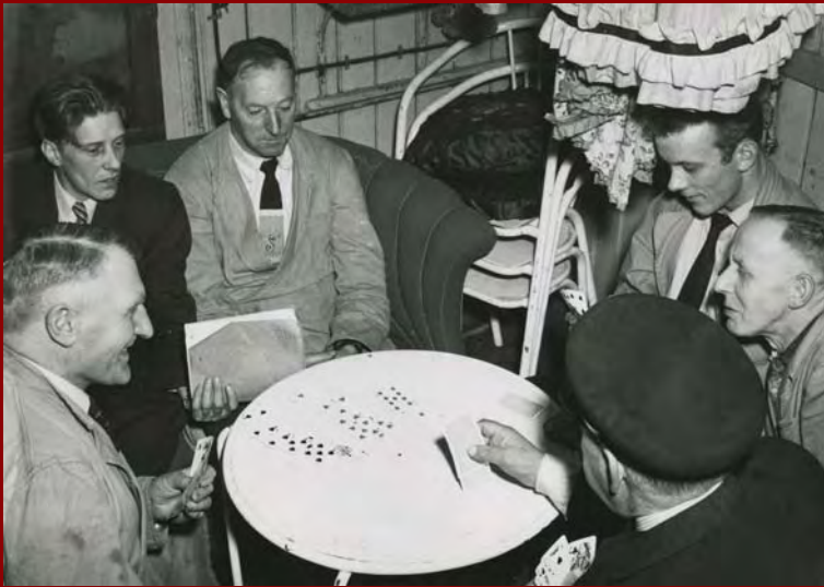
Sviðsmenn taka í spil.