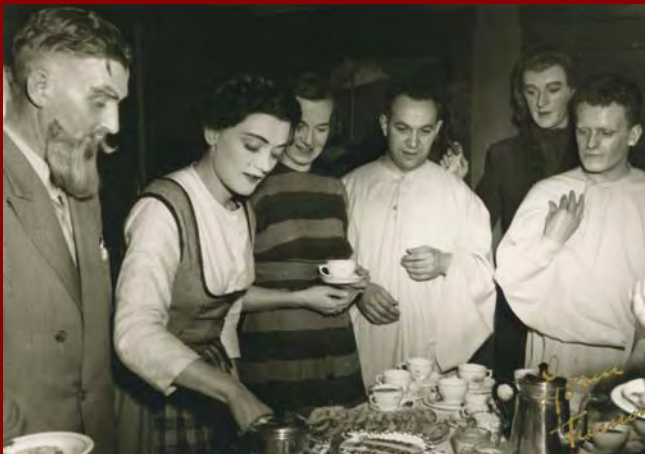
Leikarar og starfsfólk í Galdra-Lofti sem var frumsýnt 8. febrúar 1956.