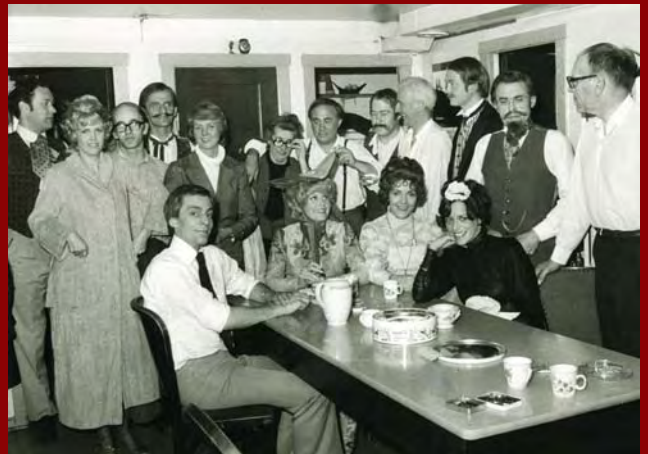
Leikarar og starfsfólk í Fló á skinni sem var frumsýnt 29. desember 1972.