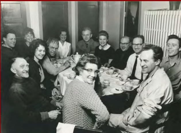
Leikarar og starfsfólk í Hart í bak sem var frumsýnt 11. nóvember 1962.