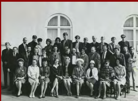
Starfsfólk Leikfélags Reykjavíkur haustið 1968

Iðnó var reist af Iðnaðarmannafélagi Reykjavíkur á uppfyllingu út í Tjörnnina árið 1896 og tekið í notkun árið eftir. Föru fyrstu leiksýningar þar fram í febrúar 1897 og var það Thorvaldsensfélagið sem stóð fyrir þeim. Salurinn vakti almenna hrifningu og skrifaði ritstjóri Ísafoldar eftir fyrstu heimsóknina þangað: „Húsnæðið er miklu betra til slíkra hluta en kostur hefir hjer verið á áður, einkum leiksviðið langt um stærra og fullkomnara; anddyri og aðrar vistarverur í húsinu einnig miklu rýmri og þægilegri. Og þar á ofan ljeku fleiri ýmist vel eða sæmilega heldur en ella gerist hjer af viðvaningum, bæði valist til í þetta sinn færara fólk yfirleitt og undirbúningur rækilegri.“