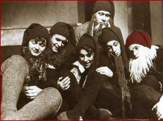
Jólaleg mynd úr Einu sinni á jólanótt sem var frumsýnt 12. desember 1969.