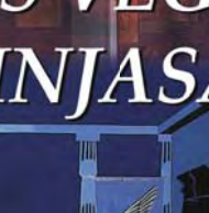
18. Leiklist í Hafnarfirði Sýning í Gúttó í samstarfi við Byggðasafn Hafnarfjarðar. 4. 6. 2010.