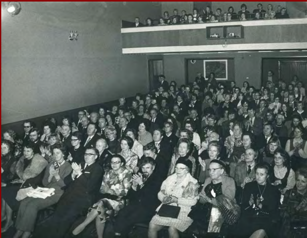
Leikhúsgestir í Iðnó.

Árið 1950 tók Þjóðleikhúsið til starfa. Þangað réðust þá langflestir burðarleikarar Leikfélagsins og þótti þá mörgum sjálfsagt að leggja félagið niður. Úr því varð þó ekki. Margt yngra fólk var að koma heim úr leiklistarnámi erlendis um þessar mundir og ljóst að það gæti ekki allt treyst á vinnu hjá Þjóðleikhúsinu. Þetta fólk sameinaðist þeim af eldri leikendum, sem ekki urðu fastir starfsmenn Þjóðleikhússins, svo úr varð öflugur leikflokkur sem gat veitt hinu nýja Þjóðleikhúsi harða samkeppni, eins þótt félagið gæti ekki boðið leikendum sömu kjör og ríkisstofnunin. Snemma á sjöunda áratugnum tókust svo samningar við Reykjavíkurborg sem gerðu félaginu kleift að ráða til sín nokkra leikendur í fast starf. Þar með varð Leikfélagið að atvinnuleikhúsi sem það hefur verið alla tíð síðan. Félagið flutti árið 1989 í Borgarleikhúsið við Listabraut þar sem það starfar nú.