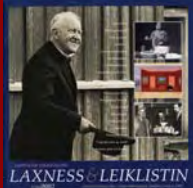
1. Laxness og leiklistin Sýning í lönó 13. 4.2002.

Leikminjasafnið hefur á ferli sínum sett upp fjölmargar stórar sýningar. Má segja að sýningarnar hafi einkum verið tvenns konar; annars vegar um feril merkra leiklistarmanna, hins vegar um leikstarfið á einstökum stöðum utan Reykjavíkur. Safnið er landssafn, tekur ekki einungis til höfuðborgarinnar, þó að hún hafi vissulega verið hér í fararbroddi frá upphafi, heldur landsins alls, atvinnuleikhúss jafnt sem áhugamannafélaga. Þá hefur jafnan verið minnst aldarafmæla helstu frumherja atvinnuleiklistar með gerð minningarspjalda sem sett hafa verið upp í leikhúsunum og jafnframt má skoða á heimasíðu safnsins, leikminjasafn.is