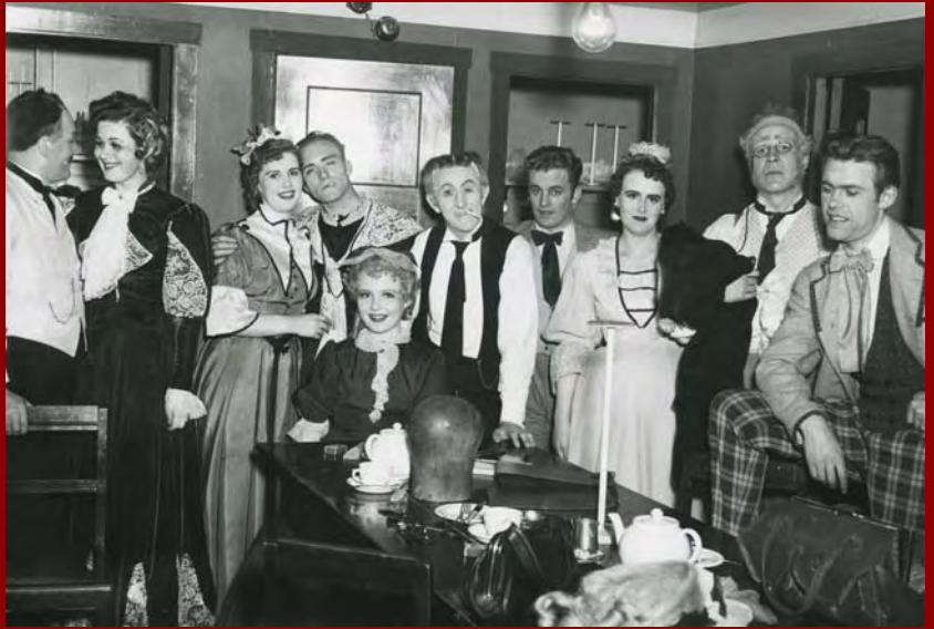
Leikarar í Frænku Charleys 1954.