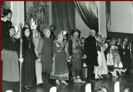
Fyrsta húsbýggingarsjóðsskemmtunin í Austurbæjarblóí haustið 1967.

Iðnó var fyrst og fremst hugsað sem almennt samkomuhús Reykvíkinga og var rekið þannig langt fram yfir miðja síðustu öld. Það var frá upphafi starfsvettvangur Leikfélags Reykjavíkur, sem var stofnað 11. janúar 1897. Með tilkomu Leikfélagsins var brotið blað í íslenskrí leiklistarsögu: félagið hélt uppi reglubundinni starfsemi og frumsýndi jafnan nokkur ný verk á hverjum vetri. Þá myndaðist þar vísir að föstum leikflokki, hópur fólks sem tók leiklistina mjög alvarlega, helgaði henni krafta sína eftir mætti og stefndi að því að undirbúa jarðveginn fyrir fullgilt atvinnuleikhús.