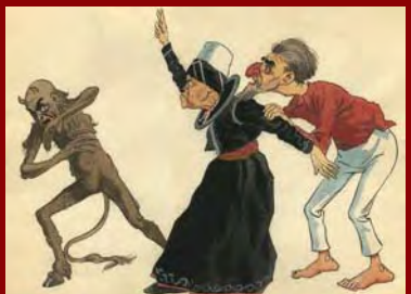
Teikning eftir Halldór Pétursson af leikurum í Gullna hliðinu í Þjóðleikhúsinu 1951.

Ég var lengi búin að horfa á Iðnó sem afskaplega „gipsvænt“ hús, sem yrði mjög fallett í jólabúningi. Í fyrstu ætlaði ég að búa til fáeina leikara til að stilla upp og prýða Iðnó , þó sérstaklega vildi ég heiðra brautryðjendur leiklistar á Íslandi, þ.e. frá aldamótunum 1900. Að lokum fór það svo að leikararnir, „vinir mínir“ úr útvarpinu urðu til og röðuðu sér allt í kringum Iðnó þótt einhverja vanti svo og yngri árganga leikara.