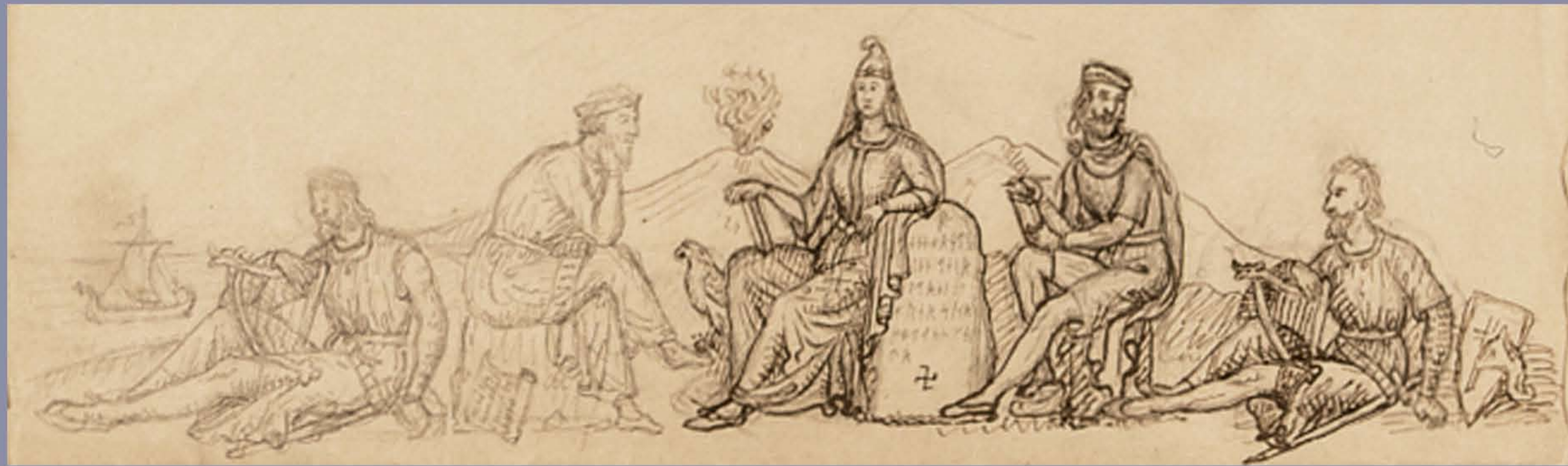
Tableaux - „lifandi mynd“ eftir Sigurð málara. „Lifandi myndir“ voru uppstillingar með leikendum í búningum sem vöktu mikla athygli á sviði Gildaskálans.